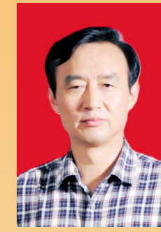
祝福新 武汉福星建设集团 有限公司董事长