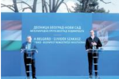
武契奇、欧尔班出席开通庆祝仪式