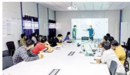
公司项目管理团队与中国五环团队讨论图纸及施工工艺流程

项目系公司与中国五环首次合作,公司自2019年以来深耕印度市场,全方位积累属地行业及供应商资源。项目业主及监理均为印度团队,中建三局三公司国际公司(海外部),精心选派英语过硬、专业能力强的业务骨干组建项目管理团队。目前,首批从印度诺伊达州抽调的管理人员已抵达现场,海外将士们将充分发扬“雷霆三实 拼闯争先”企业文化特质,以“跑步进场”姿态迅速高效推进项目各项工作,奋力开拓海外高质量发展新局面。