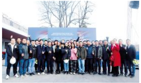
建设者在诺维萨德站合影留念

下一步，中铁十一局和中国土木联合体项目部将快速转入诺苏段的施工，安全有序推进工程建设，向实现诺苏段全线开通运营目标发起全面冲刺。