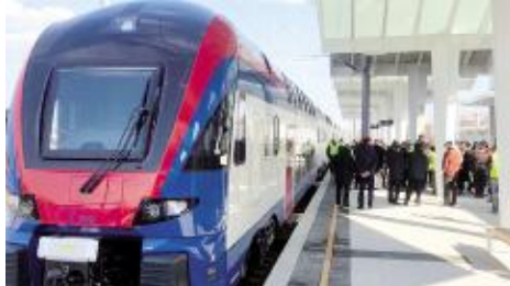
首趟列车驶入诺维萨德站

当地时间3月19日，匈塞铁路塞尔维亚境内贝尔格莱德至诺维萨德段(以下简称匈塞铁路塞尔维亚境内贝诺段)开通运营，塞尔维亚总统武契奇、匈牙利总理欧尔班、塞尔维亚总理布尔纳比奇、铁路建设施工方代表乘坐了该段铁路开通后的首班列车，由贝尔格莱德中心站驶向终点诺维萨德站，并参加在诺维萨德站广场举行的开通庆祝仪式。至此，由中铁十一局和中国土木联合体参建的匈塞铁路塞尔维亚境内贝诺段正式开通运营，塞尔维亚正式迈入高铁时代。