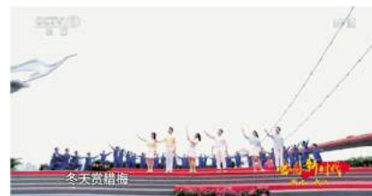
与央视合作的《唱响新时代》节目

设,成立武汉桥梁传媒有限公司,创办“中国桥博会”,坚定不移传播桥文化,努力打造中国桥梁“国家名片”,巩固世界一流建桥国家队的品牌地位。《桥文化》入选《改革开放四十周年企业文化建设优秀成果选编》。打造“中央厨房”新闻舆论工作机制,实现“一次采集、多种生成、多元发布”的全媒体生产流程。准确领会中央精神,主动进行新闻策划,2018年围绕纪念改革开放