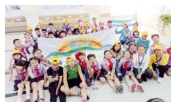
中铁大桥局党委邀请20余名扶贫村的留守儿童走出大山看大桥