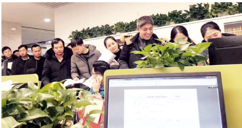
农民工开心领工程款，平安返乡过年

准备”，联系对口银行，拓宽资金筹措渠道，为支付过程中可能出现的突发状况制定了备用方案。