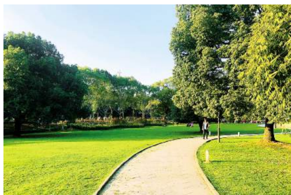
公园一角