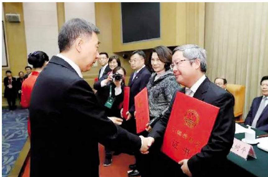
中国质量奖颁奖现场

展轮训、主题演讲等活动,教育引导党员干部树牢“四个意识”、坚定“四个自信”、做到“两个维护”。全年共举办党员培训班20期、培训1367人次。提升党委理论学习中心组学习学习质量和规范化水平,加强理论研讨,落实“一学一报”通报制度和“参学督学”制度。坚持理论与实践相结合,深入开展理论研讨和调研工作,20篇政研论文被股份公司党委和湖北省国资委刊载推广。以“大桥杯”劳动竞赛、“凤凰山讲坛”、“桥工道德讲堂”为载体,创造性构筑职工思想政治工作“三大平台”,被评为“湖北省宣传思想文化工作创新项目”。