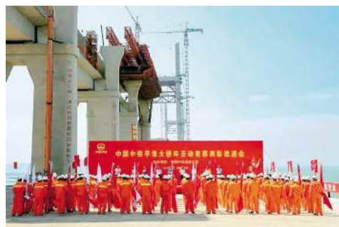
中国中铁“平潭大桥杯”劳动竞赛表彰推进会

体系。创新建立了二维的横向、纵向责任矩阵,明确了各级责任主体和责任人的党建责任和工作清单,形成了党建工作标准化及其考核办法,到达了“做什么、看清单,谁来做、看矩阵,怎么做、看说明”“要求什么就做什么,做什么就考核什么,主责是谁就考核谁”的目的。自主研发“大桥红”智慧党建工作平台,将党建工作标准化在网络平台上运行,以降低工作成本,以提高工作效率。2018 年,中铁大桥局党委在湖北省国资委党委开展的党委书记抓基层党建工作述职评议考评中排名第一。