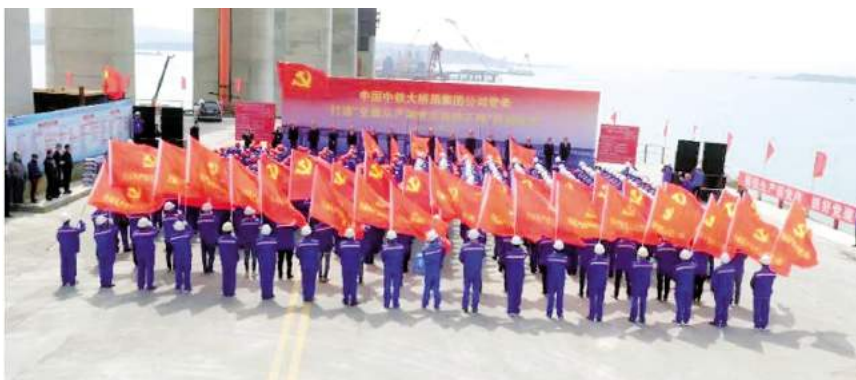
打造“全面从严治党示范性工程”活动

内容的“同、融、化”境外党建“三字工作法”。孟加拉帕德玛大桥党建工作得到了国资委调研组的高度评价。