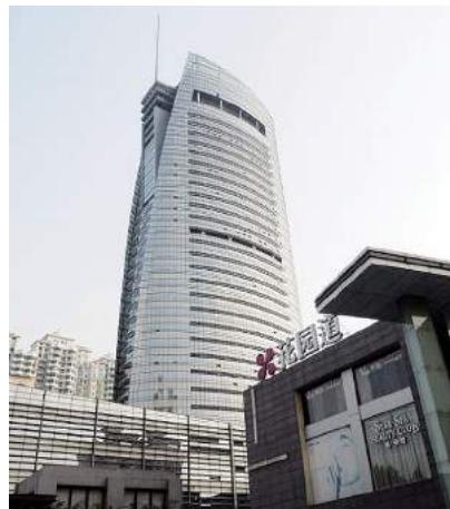
武汉广电中心大楼