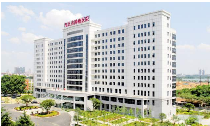
湖北省肿瘤医院新建住院大楼

筚路蓝缕，以启山林；革故鼎新，实干兴业。山河集团辉煌发展的50年，是诚信立企最好的注脚。作为湖北省建筑业的领军企业，未来，山河人将秉持诚信这张“通行证”，深耕主业，砥砺奋进，“筑品质山河成百年基业”，为湖北实现建筑大省向建筑强省跨越发展贡献力量。