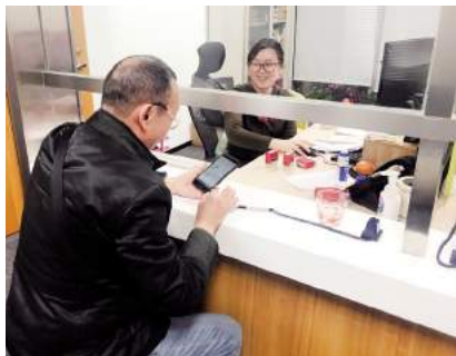
武汉建工集团为农民工耐心服务

集团工程管理部加强对分包分供单位的管理考核，及时跟进项目进度；商务管理部保持与各项目部的密切联系，保证核算及时到位；财务资金部提前了解资金需求，全员上阵，及时完成资金计划安排，落实各项目收付款计划，提前做好“两手