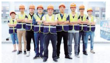
天河机场交通中心项目团队

最终,辛亥革命博物馆项目成功斩获中国建设工程鲁班奖、中国钢结构金奖、湖北省建设优质工程(楚天杯)、湖北省建筑工程安全文明施工现场(楚天杯)、湖北省建筑业新技术应用示范工程、全国建设工程优秀项目管理成果一等奖、全国工程质量管理工作一等奖、湖北省建筑节能示范工