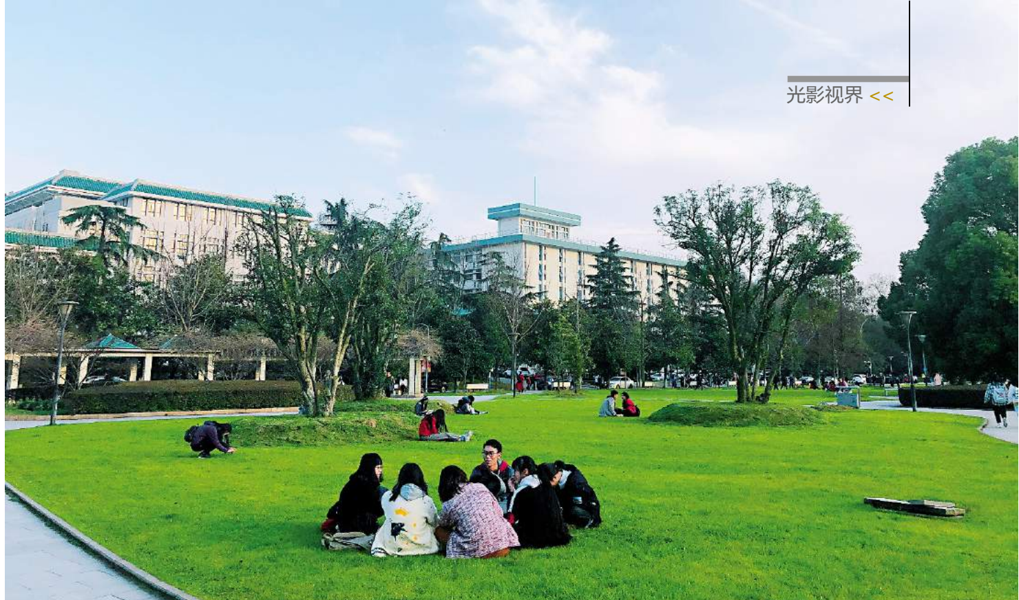
青葱校园