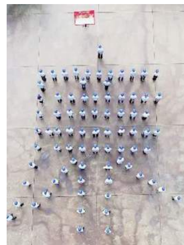
党风廉政建设宣传教育活动

行重点教育,着眼“绝大多数”,针对全体党员干部,每年确定一个主题,深入开展党风廉政建设宣传教育活动。发挥巡视巡察“利剑”作用,积极配合股份公司党委巡视,分3批、对16家单位进行了内部巡察,实现了对子分公司巡察全覆盖。建立健全线索督办机制和违纪违法典型问题通报曝光制度。2018年,共立案20件,给予党纪政纪处分62人,组织处理51人。立案数较去年上升33%,处分人数上升78%,释放出力度不减、尺度不松的强烈信号。