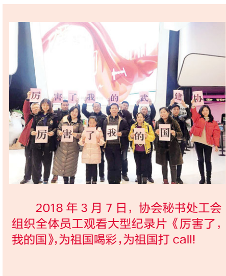
2018年3月7日，协会秘书处工会组织全体员工观看大型纪录片《厉害了，我的国》，为祖国喝彩，为祖国打call!

2018年3月31日 星期六 总第 282 期 新闻热线 027-85499752