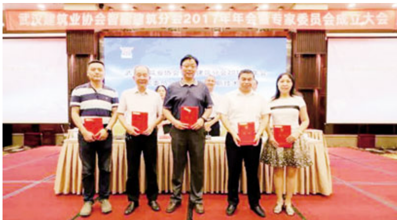
协会智能建筑专家委员会专家代表颁发聘书

武汉协智能建筑分会过去一年取得的成绩给予了肯定,他希望协会深入研究探索工作机制,推动智能建筑行业贯彻落实国家政策,把建筑智能化融合到各个领域,抓住改革机遇实现重生蜕变,体现智能建筑作为一个技术型、支撑型、服务型行业的价值与作用。