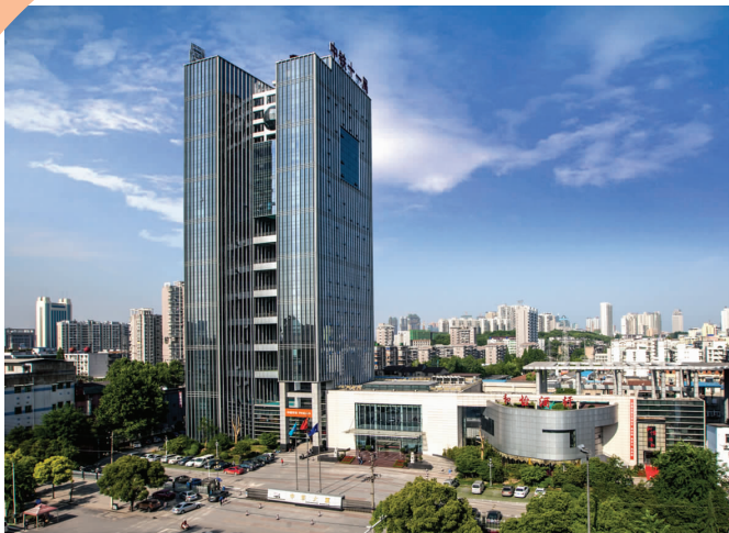
集团公司总部办公大楼

业年施工能力500亿元以上，在建工程项目600余个，分布在全国除港澳台以外的所有省、直辖市、自治区以及海外。